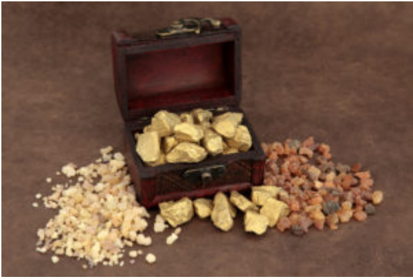
Gold frankincense and myrrh and an old wooden box over brown