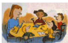
Document IV : Fiches d'animation