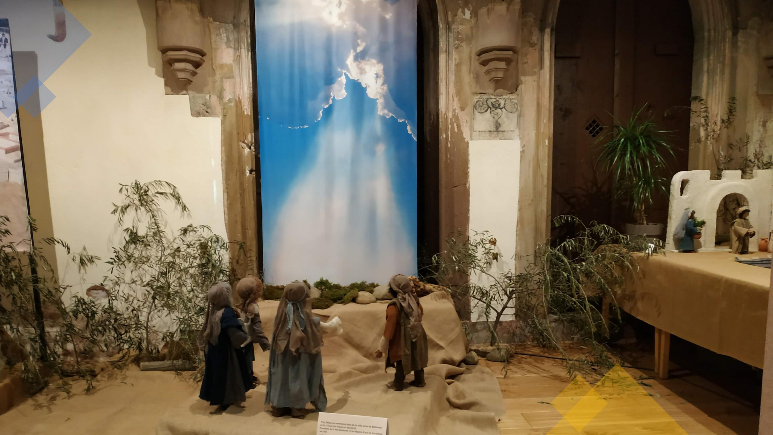
Puis, Jésus des essénites, frère de la ville, gère de Bethléem et de la terre très magique et des saints. Pensons que si nos héros, il se réalisent à leur et fait sentir au ciel.