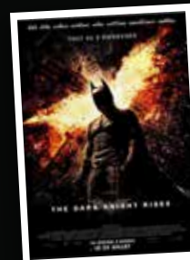
THE DARK KNIGHT RISES de Christopher Nolan avec Christian Bale, Gary Oldman et Tom Hardy, 2012