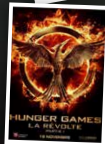
HUNGER GAMES 1-2-3 avec Jennifer Lawrence, 2012, 2013 et 2014