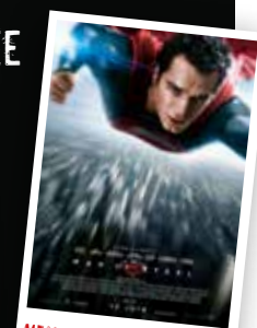
MAN OF STEEL de Zack Snyder avec Henry Cavill et Amy Adams, 2013