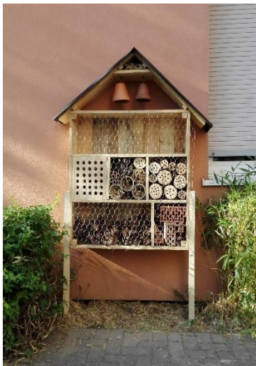
L'hôtel à insectes réalisé par les enfants de la paroisse et du quartier de Hautepierre

https://www.youtube.com/watch?v=EINP3vZL46Y&ab_channel=MarieWild