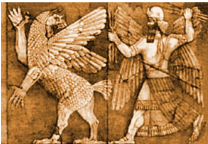
Mardouk tuant Tiamat

Babylone est également une ville sainte, avec de nombreux temples dédiés aux différents dieux de Mésopotamie. Mais le grand temple est l'Esagil, qui est littéralement la maison du roi des dieux : Marduk.