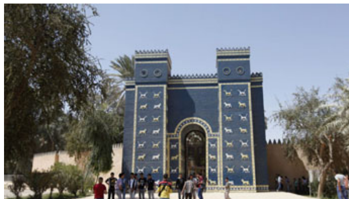
La célèbre porte d'Ishtar

La célèbre porte a été reconstruite dans un musée à Berlin au Pergamon Museum parce que les grandes expéditions archéologiques du début XXe siècle étaient allemandes. C'est par cette porte que le roi rentrait triomphalement dans la ville après une campagne militaire.