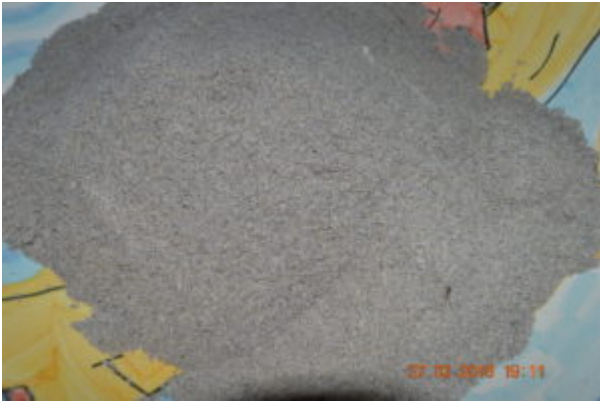
La pâte à sel au café colorée