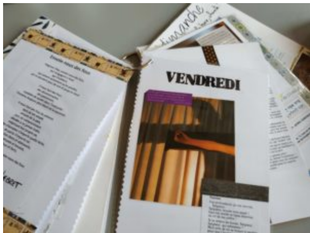
Carnet de prières pour la semaine sainte

L'intention de ce carnet de prière est de s'approprier des textes, de les décorer pour avoir envie d'y revenir souvent et régulièrement grâce à une mise en page sous forme ludique et transportable (des feuilles A5 plastifiées et reliées par un anneau).