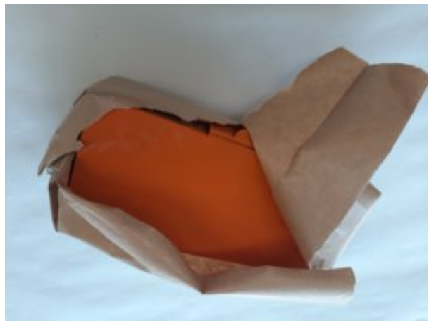
Des images pour les bricolages